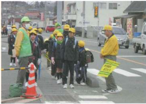
下校時のあいさつ運動及び防犯見守り活動

交通事故や犯罪に巻き込まれないようにパトロール活動等を行っています。また、虐待の早期発見・早期対応のため、児童相談所と連携して、子育て家庭の見守りや相談支援に取り組んでいます。