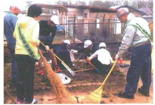
小学生のボランティア活動のサポート

子どもたちの健全育成をサポートするため、学校とも密接に連携し、行事への参加や福祉教育への協力、課題のある家庭への支援等に協力しています。