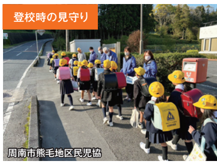
周南市熊毛地区民児協