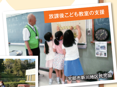
放課後子ども教室の支援