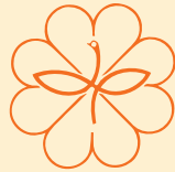
民生委員・児童委員のマーク